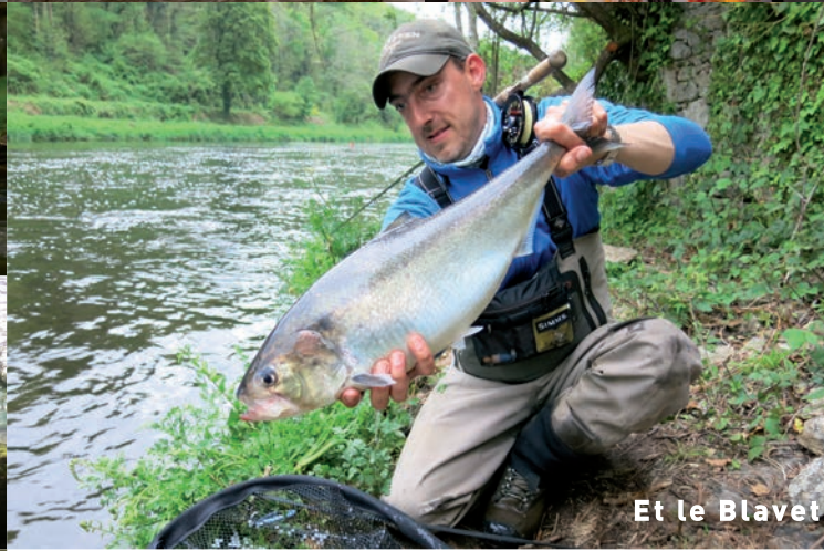
Et le Blavet